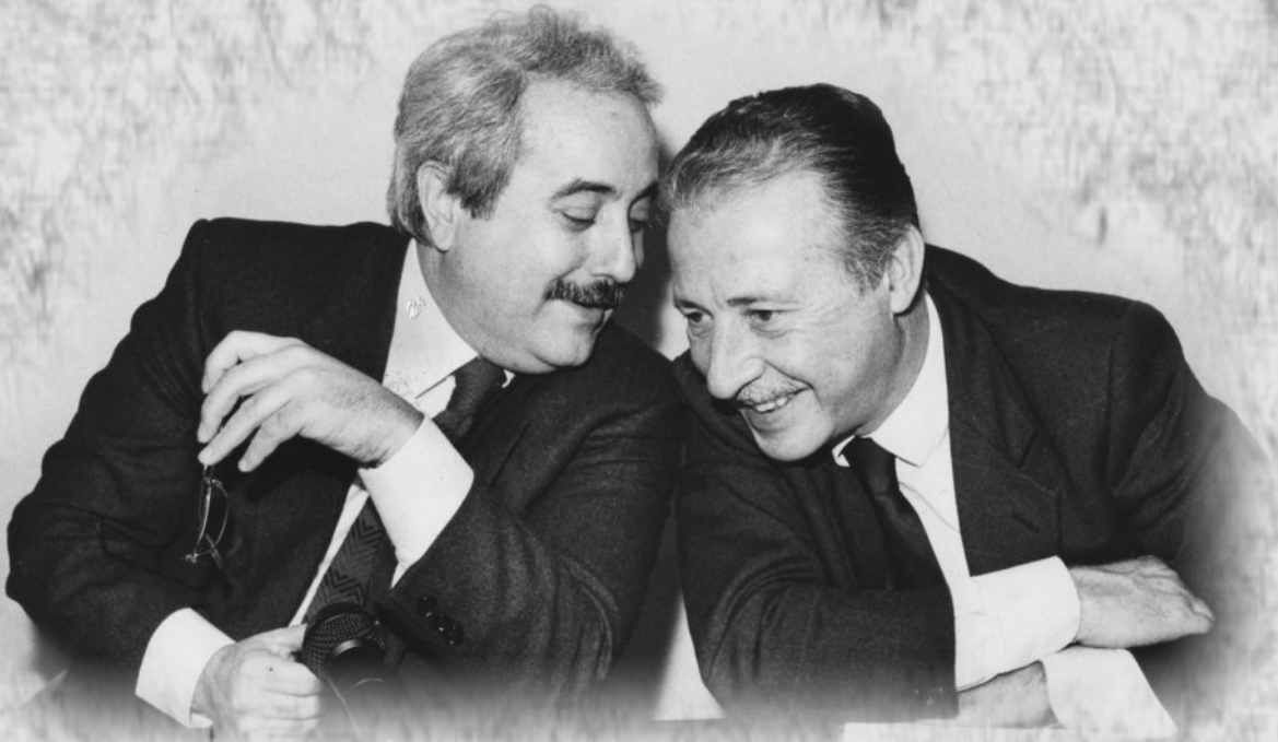
GIOVANNI FALCONE & PAOLO BORSELLINO